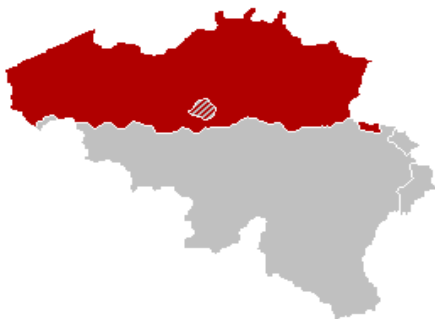
Figuur 1: Vlaamse Gemeenschap

Er zijn drie gemeenschappen. De Vlaamse Gemeenschap verzamelt de inwoners van het Nederlandse taalgebied en de Nederlandstaligen in Brussel. De Franse Gemeenschap groepeerde de inwoners van het Franse taalgebied en de Franstaligen in het Brussels Hoofdstedelijk Gewest. De Duitstalige Gemeenschap verzamelt de circa 70000 inwoners van het Duitse taalgebied.