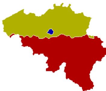
Figuur 4: Het Vlaams, het Waals en het Brussels Gewest

Er zijn drie gewesten: Het Vlaams, het Waals en het Brussels Hoofdstedelijk Gewest. Het Vlaams Gewest omvat het Nederlandse taalgebied met de provincies West-Vlaanderen, Oost-Vlaanderen, Antwerpen, Limburg en Vlaams-Brabant. Het Waals Gewest omvat het Franse en Duitse taalgebied met de provincies Waals-Brabant, Henegouwen, Luik, Namen en Luxemburg. Het Brussels Hoofdstedelijk Gewest valt samen met het tweetalige gebied Brussel-Hoofdstad, waar beide talen volgens de grondwet op gelijke voet behandeld moeten worden. De gewesten en gemeenschappen hebben elk hun eigen wetgevende en uitvoerende organen, meer bepaald de parlementen en de regeringen. In Vlaanderen zijn de gewestelijke- en gemeenschapsinstellingen samengesmolten. In Vlaanderen is er dus maar één parlement en één regering (Vlaamse Overheid, n.d.).