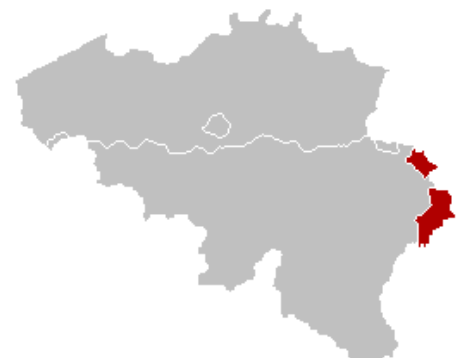
Figuur 3: Duitstalige Gemeenschap