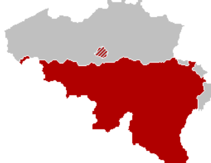
Figuur 2: Franse Gemeenschap