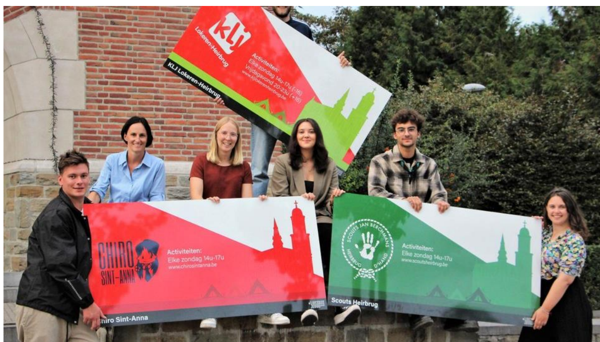
Foto: Uithangborden voor de Lokerse jeugdverenigingen

Ook in Sint-Niklaas bracht men alle jeugdverenigingen in kaart. Groep INTRO en JOS vzw – de ondersteuner van het jeugdwerk in Sint-Niklaas – bundelden hiervoor hun netwerk en expertise. Samen verspreidden ze een helder overzicht van het jeugdaanbod. Groep INTRO waakte er mee over dat de verzamelde informatie bruikbaar was voor gezinnen in een kwetsbare positie en ging het overzicht persoonlijk voorstellen bij heel wat sociale en intermediaire partners. In Lokeren kregen alle jeugdverenigingen een uithangbord om hun werking meer zichtbaar te maken.