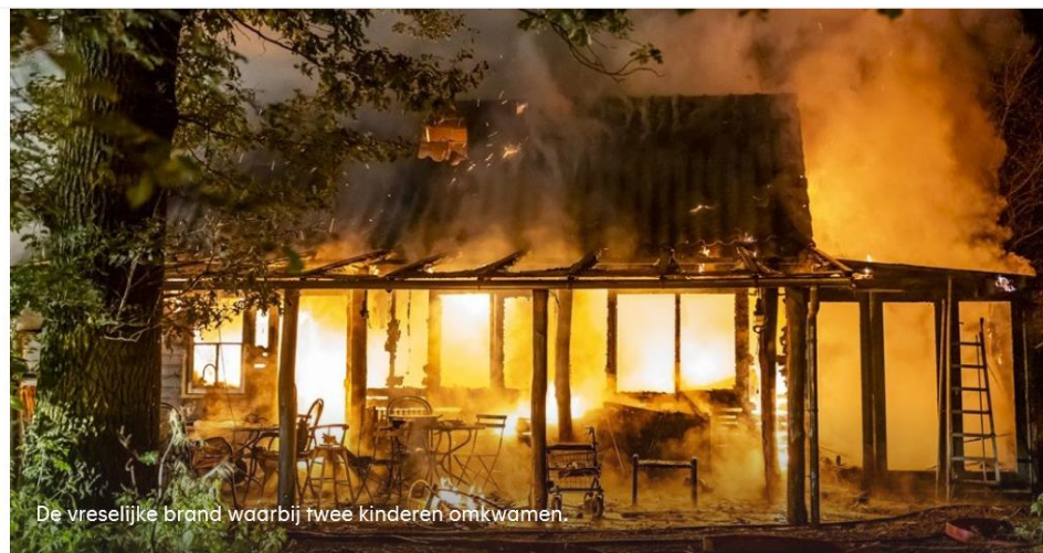
De vreselijke brand waarbij twee kinderen omkwamen.