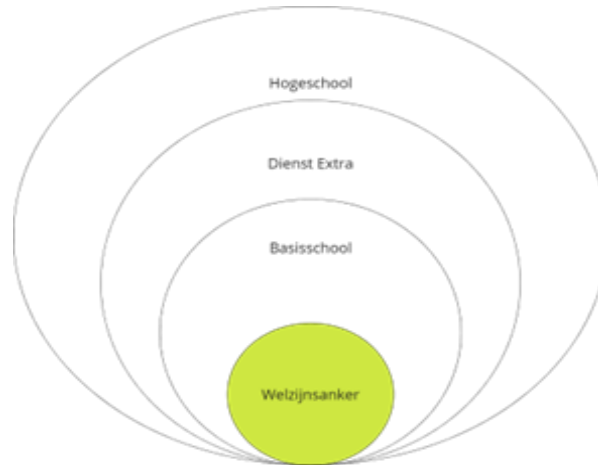
Figuur 3 - drievoudige ondersteuning van de welzijnsankers

Het Welzijnsanker werkt in de eerste plaats in de basisschool , met de zorgcoördinatoren als stagementoren . Ze zijn de voornaamste steunfiguren van de welzijnsankers en ondersteunen hen op dagelijkse basis: aanmeldingen doorgeven, hun vragen te beantwoorden, hen wegwijs te maken in de school en het bredere netwerk aan organisaties in de wijk. De zorgcoördinatoren evalueren studenten vooral op niveau van het dagelijkse functioneren, de samenwerking met het schoolteam, hoe men contact maakt met ouders en het werkplekleren op de school: